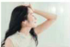
超音波コーム+トリートメント