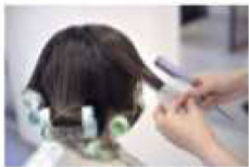
超音波コーム+パーマ