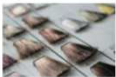
超音波コーム+カラー